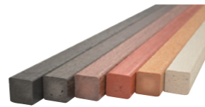
■ プラスチック擬木「エコロ木®」