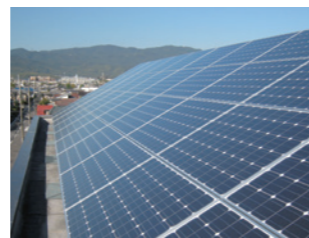
■ 本社屋上太陽光発電設備