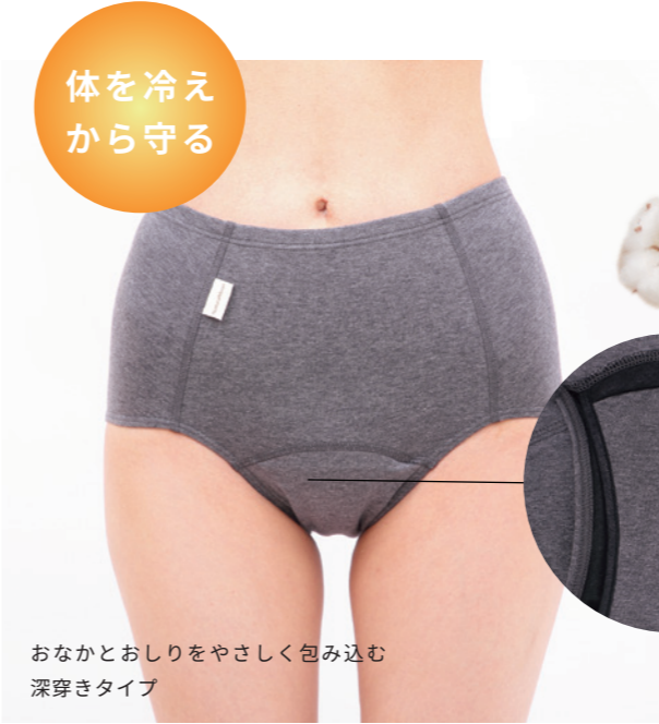
おなかとおしりをやさしく包み込む 深穿きタイプ