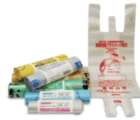
■ 自治体向けロール式有料指定ごみ袋