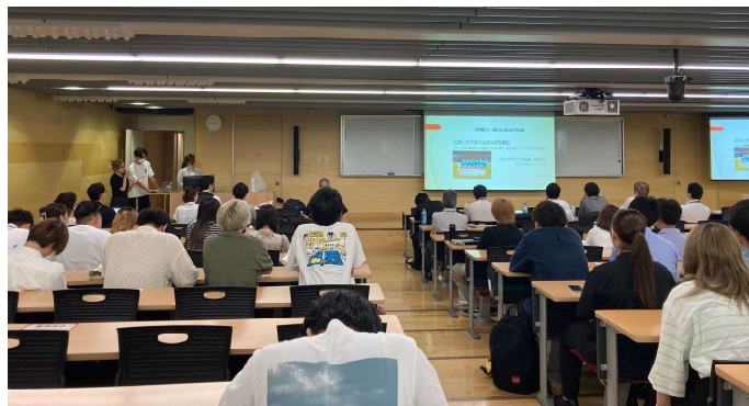
国土館大学 課題解決型授業 最終発表会 (2023年7月12日)