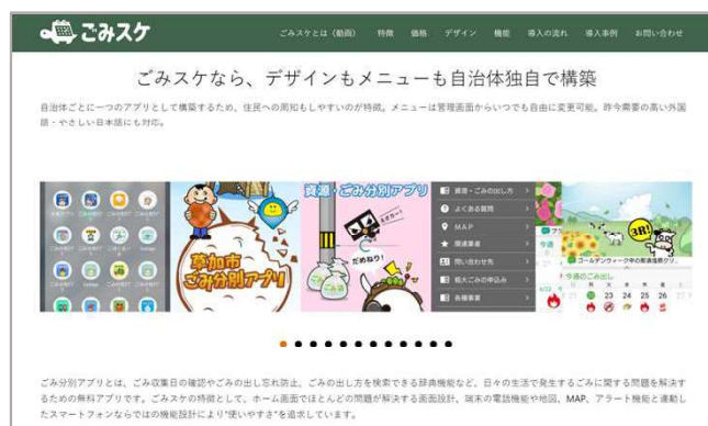
「ごみスケ」トップページ

G-Placeが提供する地域の課題解決・活性化につながる自治体向け製品の検索サイト。