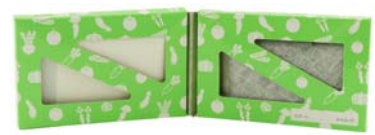
【カートリッジを開いた図】