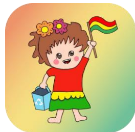
【ボリビア向けごみ分別アプリホームアイコン】